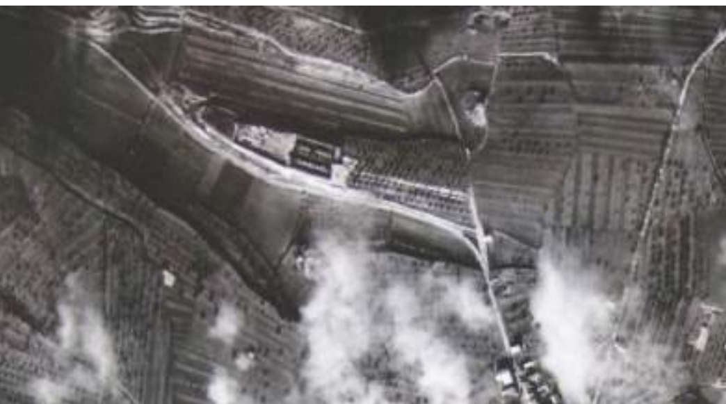
Ampliació de la fotografia del bombardeig sobre Cervera del 3 de desembre de 1938 on es veu el cementiri amb la part nova construïda el novembre de 1936. Pot apreciar-se la rasa o forat, tocant al mur de tancament oest.

Doncs bé, el llibre que recensionem conté, sobretot, però no només, els records d'algunes d'aquestes famílies que de tot l'Estat i de tot Catalunya s'han desplaçat a