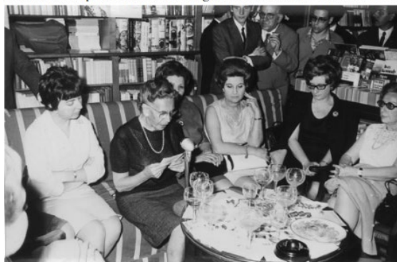
Aurora Bertrana presenta el seu llibre Aigua tèrbola. Llibreria Catalònia, 1967

És un caire molt femení de la seva personalitat literària aquest autoretrat i aquesta autocrítica. No us n'acabeu de fiar.