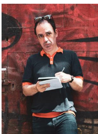
@Jordi Borràs Abelló

«Sempre dic que la gent no coneix el que passa fora de Barcelona, el “cap gros” s’ho menja tot, quan es passa el check point de la Panadella s’entra en un skyline que ja no tenim al cap. Es coneix el paisatge de l’Empordà o dels Pirineus però no el de Ponent.» La Vanguardia .